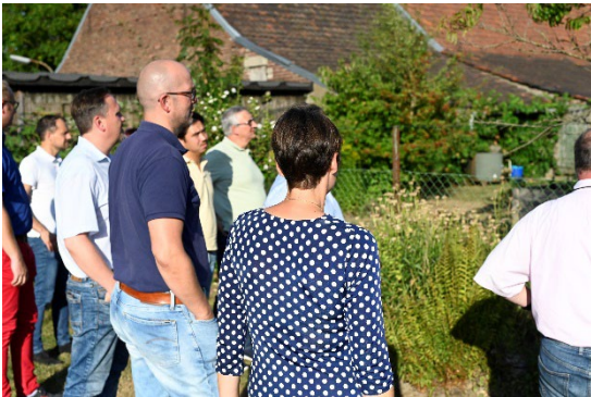
Beeindruckt sind die UKK-Mitglieder vom naturnahen Ambiente der Coaching-Farm Keens Hof am Hülser Bruch.

Die Angebote des Keens Hof unter dem Motto „Strategische Auszeit vom Alltag“ richten sich an Unternehmensgruppen. Bei den Workshops geht es u.a. um Teambuilding, Selbstmanagement, Kreativ- und Resilienztraining sowie Unternehmenskultur.